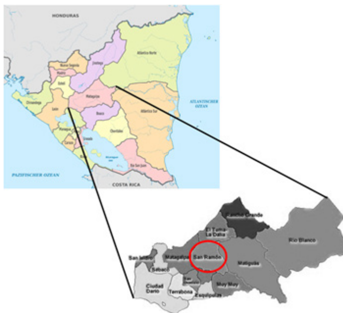
Gráfico 1. Zona de Estudio

El universo de estudio fueron 5 653 hogares, ubicados en el área urbana y rural del municipio de San Ramón. El área urbana está dividida en 9 barrios y el área rural formada por 11 comarcas con 51 comunidades.