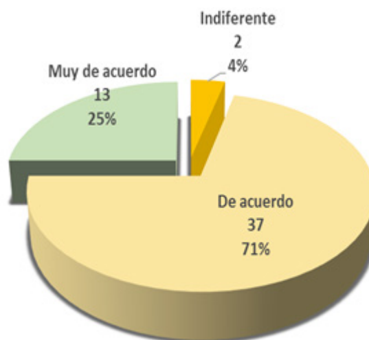
Figura 2. Actitud de los docentes hacia la integración de las TIC

En la figura 2 se puede observar que el 96% de los docentes manifiestan actitudes de acuerdo hasta muy de acuerdo hacia la integración de las TIC y solo el 4% se muestra indiferente. Sin embargo, en la entrevista al director del POLISAL y directores de departamento se evidencia que hay opiniones diferentes sobre la actitud de los docentes hacia la integración de las TIC. Entre las actitudes de los docentes hacia la integración de las TIC se mencionan positiva pero recesiva 1 . Orantes (2009) plantea, que las actitudes funcionan como modelos mentales, les dan a la persona una preferencia positiva o negativa sobre el objeto, una situación con la que se está en contacto, las actitudes de los docentes pueden variar desde los que están completamente de acuerdo con las bondades hasta los que las ven como una amenaza que atenta contra el proceso de enseñanza-aprendizaje.